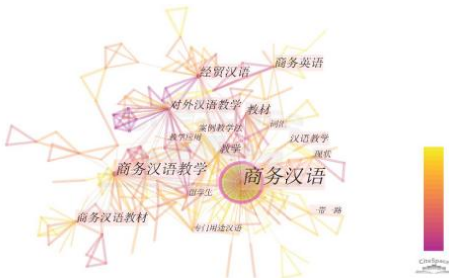
图 2 1999-2020 年间商务汉语文献高频关键词视图

关键词可以高度概括并凝练某一学科领域的研究主题与研究内容。关键词频次高说明围绕该主题进行研究的文献多,是展现某一学科领域研究热点的指数之一。利用 CiteSpace 对 232 篇商务汉语研究文献进行关键词共现分析,得到 374 个关键词,词频为 3 次及以上的关键词有 27 个,词频只有 1 次的关键词有 299 个。图 2 显示了词频为 4 及以上的关键词,分别为:商务汉语、商务汉语教学、经贸汉语、商务英语、商务汉语教材、对外汉语教学、教材、教学、汉语教学、案例教学法、现状、词汇、《商务馆学汉语词典》、一带一路、专门用途汉语、教学应用、留学生。“商务汉语”作为排名第一的高频词,频次为 84,中心性为 0.76,在共现网络中关联度高,“商务汉语”已成为该领域研究的核心关键词。从高频关键词的分布来看,国内商务汉语领域研究特点为:商务汉语研究起始于经贸汉语课程实践研究,以外国留学生为主要教学对象,主要依托对外汉语教学相关基础理论,始终围绕并聚焦“教学实践应用”与“教材编写”,同时借鉴商务英语研究成果与研究范式开展研究;商务汉语词汇、专门用途汉语教学、“一带一路”、案例教学法是商务汉语教学研究的重要特征与研究热点。