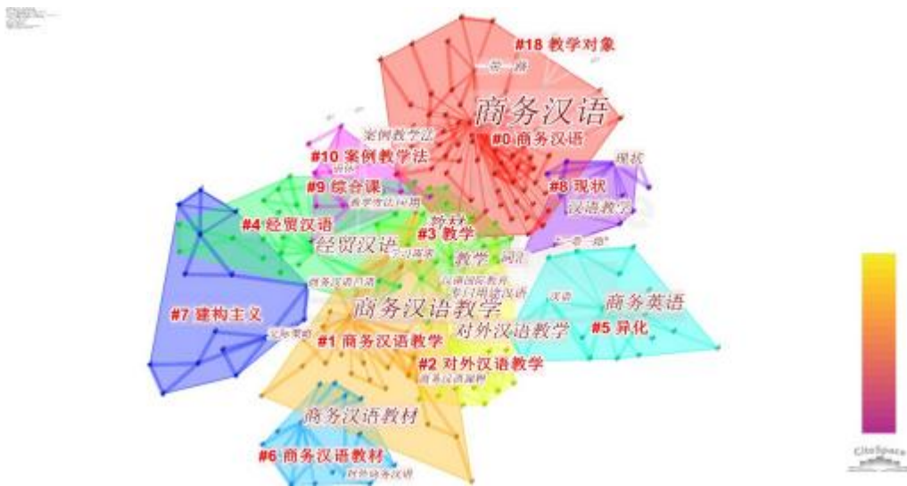
图 4 1999-2020 年间商务汉语文献关键词聚类图